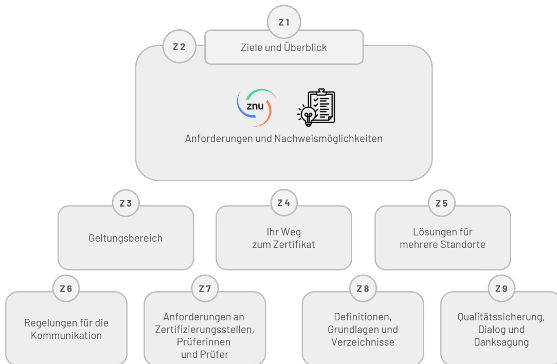
Abbildung 1 (Z 1): Überblick über alle Dokumente des ZNU-Standard Nachhaltiger Wirtschaften, eigene Darstellung

Die folgende Grafik gibt Ihnen einen Überblick über alle Standard-Dokumente Z 1 bis Z 9, die als Ganzes die Inhalte und Anforderungen des ZNU-Standard beschreiben. Ausführliche Informationen rund um den ZNU-Standard finden Sie auf der Webseite www.znu-standard.com .